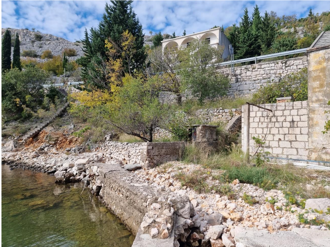
Slika 1. Od spojne linije M1 do lomnih točaka 1 i 6