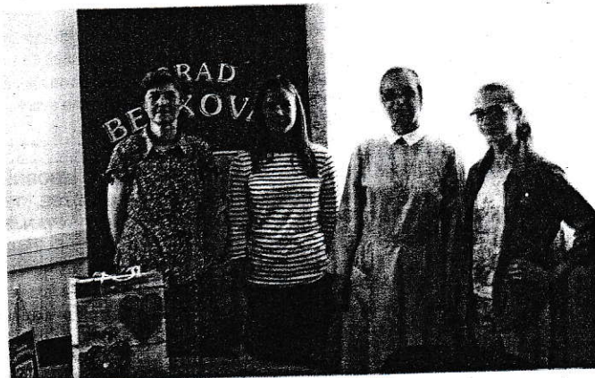
Nagrađene učenice s poklonima

– Vjerujemo kako će naše škole i dalje stvarati odlične učenike, koji će svojim daljnjim školovanjem stjecati nova znanja i vještine, te na taj način oplemenjivati našu sredinu i doprinositi time njezinom sveukupnom razvoju – kazao je gradonačelnik Tomislav Bulić. (ZL)