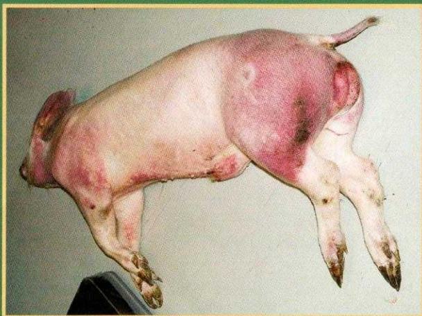
Krvavi proljev i crvenilo na koži vrata, grudi i nogu

ASK se manifestira različitim kliničkim znakovima. Zaražene, bolesne svinje uglavnom ugibaju. Obično se javlja gubitak apetita, ležanje i nevoljkost, a svinje brzo i iznenada uginu. Rijetko se pojavljuju drugi klinički znakovi: potištenost, gubitak tjelesne težine, krvarenja na koži (vrhovi uški, rep, noge, grudna i trbušna regija), otežano kretanje i pobačaji krmača. Klinički znakovi se teže uočavaju u divljih svinja.