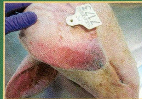
Cijanoza – plavo ljubičasta boja na vrhovima uški