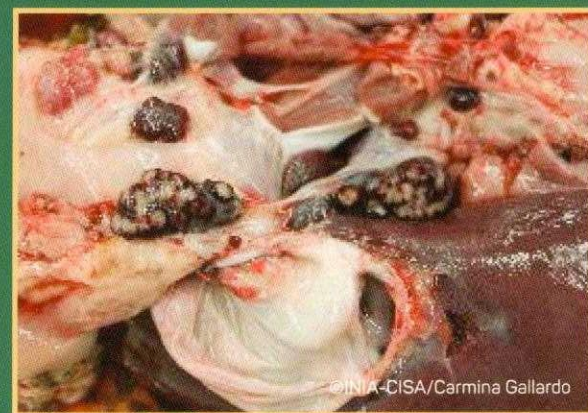
Krvavi limfni čvorovi