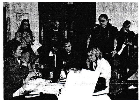
Liječnička provjera prije darivanja krvi

– Planirali smo od 16 do 18 sati no kako nam je došlo više ljudi akcija je produ-