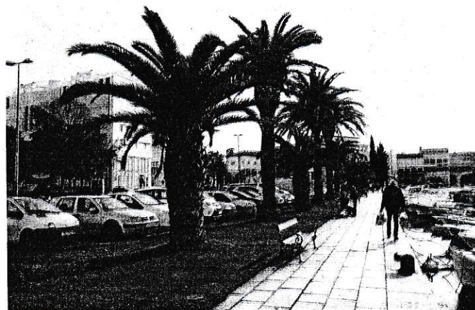
Palme su simbol šetnice u Jazinama

– Kroz idućih godinu do dvije očekuje se realizacija i tog projekta, rekao je Škibola.