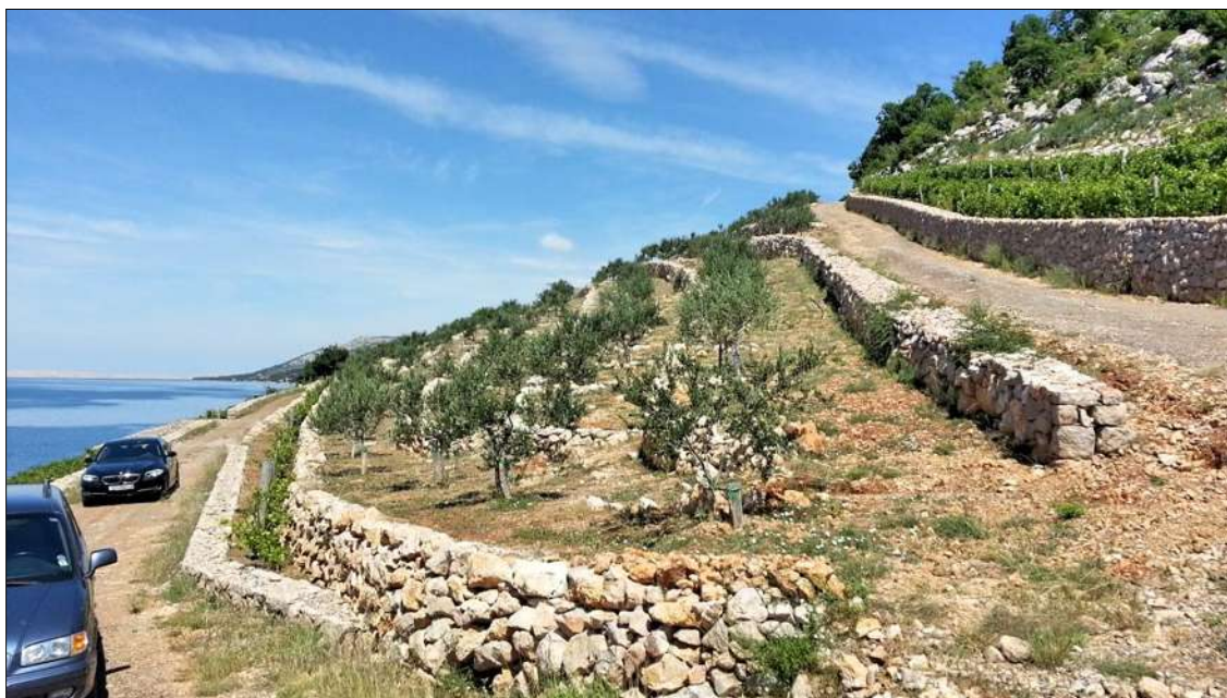
slika 4: središnji dio obale

Područje obuhvata nalazi se unutar zaštićenog područja Parka prirode Velebit koji je utvrđen temeljem Zakona o zaštiti prirode . Još uvijek nije donesen Prostorni plan parka prirode Velebit. Sukladno Uredbi o ekološkoj mreži cijeli obuhvat UPU-a nalazi se unutar područja ekološke mreže značajnog za vrste i stanišne tipove HR5000022 - Park prirode Velebit i područja ekološke mreže značajnog za ptice HR1000022 - Velebit . Mjere zaštite se propisuju u provedbenom dijelu ovog teksta.