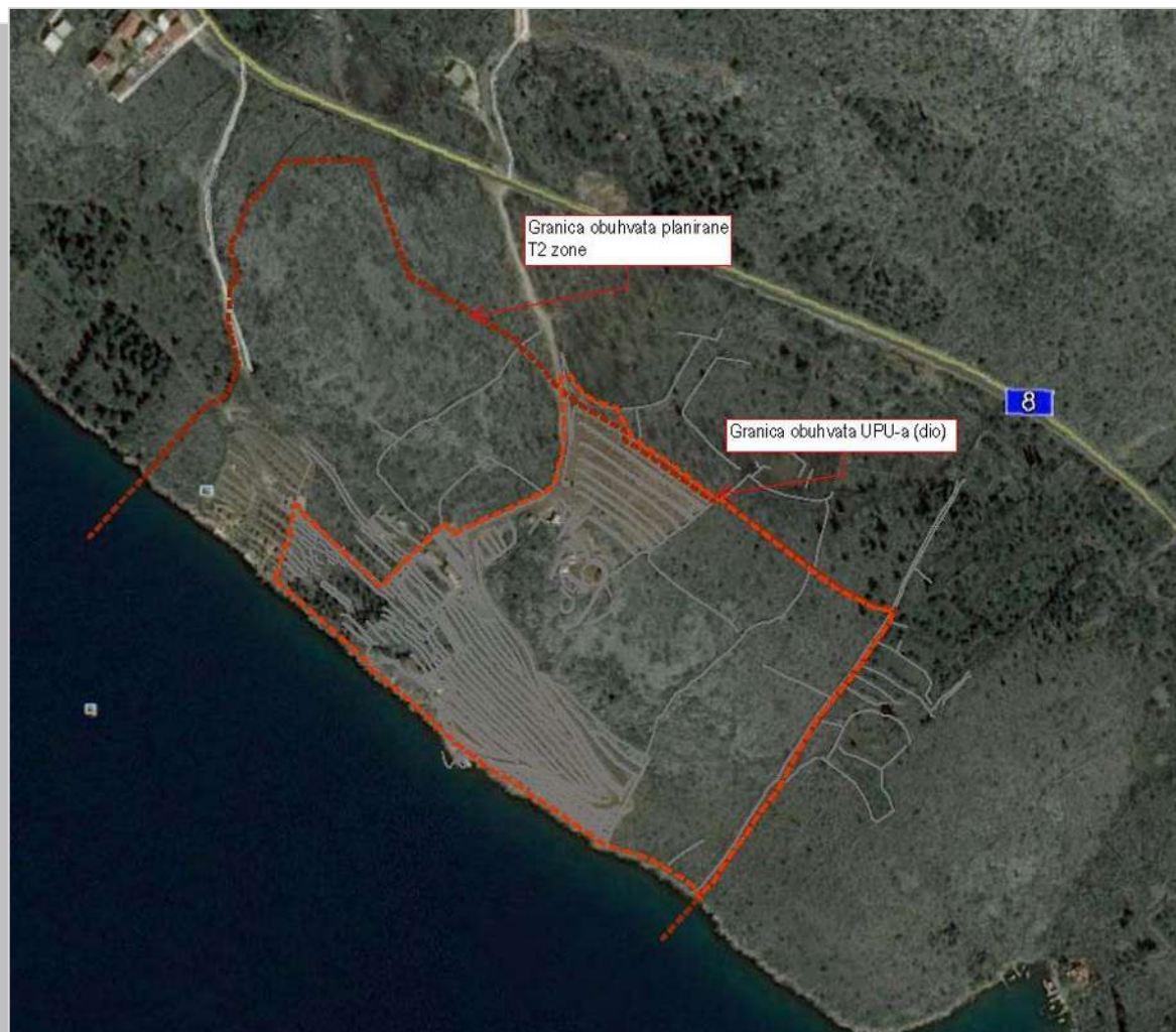
Slika 2: područje obuhvata

Područje obuhvata je dobro prometno povezano sa širim okruženjem, što je omogućeno gotovo izravnim pristupom državnoj cesti DC 8 ("Jadranska magistrala"), udaljena sto tridesetak metara od ulaza u zonu. Državnom cestom omogućen je kvalitetan pristup širem području Zadarske županije i dalje.