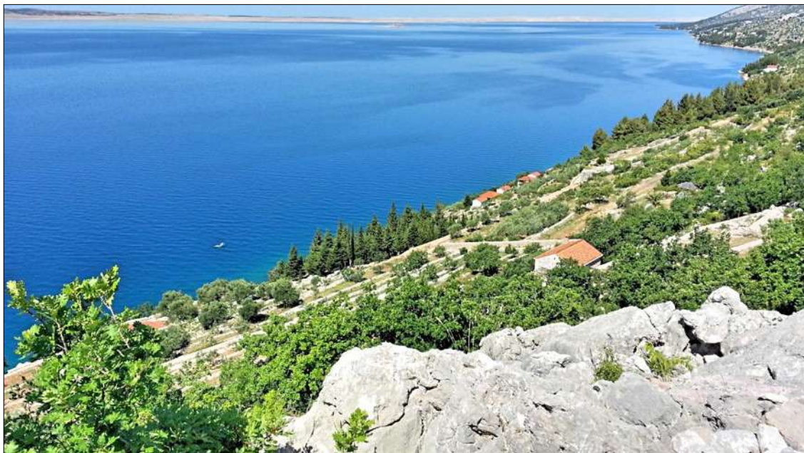
slika 3: pogled prema sjeverozapadnom dijelu područja obuhvata Plana