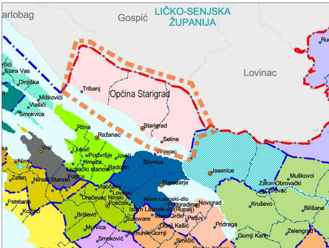
Slika 1: položaj i okruženje Općine Starigrad

Područje obuhvata dijela Urbanističkog plana uređenja ugostiteljsko-turističke zone "Milovci - Grabovača" u Starigradu (u daljnjem tekstu UPU ili Plan) pripada naselju Starigrad. Naselje Starigrad pripada istoimenoj Općini.